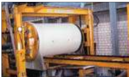
Rørene tæthedsprøves i specialudviklede prøvestande.

pet kontrol eller specielt kontrolniveau foretages et øget antal tæthedsprøvninger.