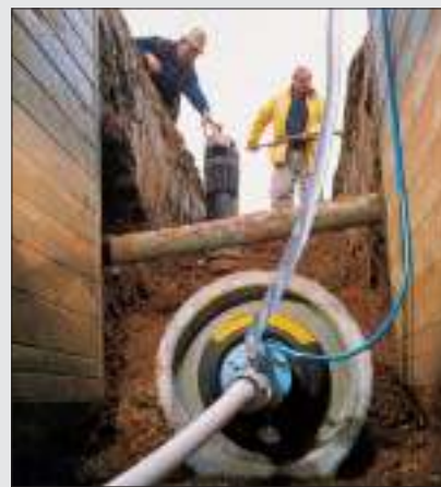
Tæthedsprøvning udføres let med specialudstyr. Her er der vist en vandtæthedsprøvning.

DS 455 afløses i løbet af 2 år af en ny europæisk norm, EN 1610, Norm for lægning og prøvning af afløbsrør. I normen findes hele 4 forskellige tæ- thedskrav, dog uden vejledninger til krav og ingen krav til stikprøveom- fang. Disse anbefalinger og krav skal først udarbejdes af afløbsbranchen blandt andet på baggrund af indkom- ne erfaringer med prøvningerne. Branchen må desuden tage stilling til om kravene i tilstrækkelig grad sikrer kvaliteten.