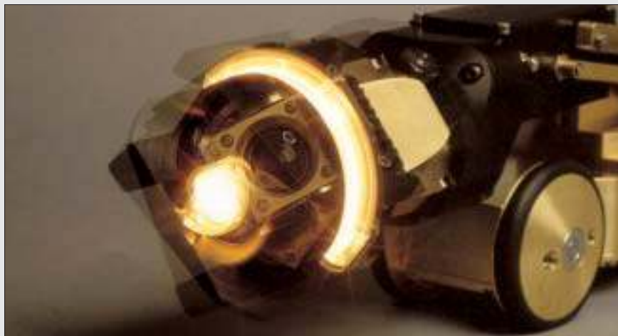
De højtudviklede kameraer er med til at sikre en effektiv kontrol af de lagte ledninger.

Det skønnes, at der konstateres små indsvivninger på under 0,1 % af de af-