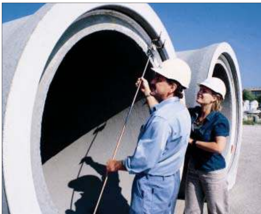
Betonafløbskomponenters samlingsmål kontrolleres med måleværktøjer, som måler med 1/10 mm's nøjagtighed.

På et punkt er normen umiddelbart skærpet i forhold til den danske norm. Prøvetrykket ved stikprøvetæthedskontrollen er øget, således at der nu skal anvendes 5 m vand-søjle fremfor 3 m. Men normen kræver modsat kun få stikprøver pr. produktionsserie, så de danske rørproducenter betragter ikke normen som en skærpelse af tæthedskravene ved produktionen.